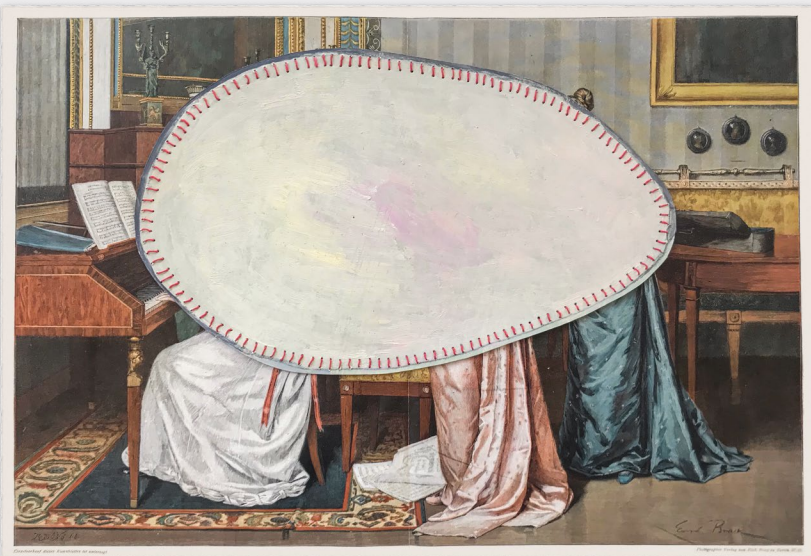
»The Blind Spot« Malerei, Collage 2020

Kunststoff, Amethyst, Prasiolith, Silber, Saphire Halle an der Saale, 2020