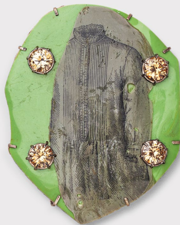
Brosche »In the Evening« Silber, Wellpappe, Kunststoff, synthetische Steine 2015