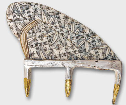
Brosche »Piano« Silber, Blattgold, Bein 2007